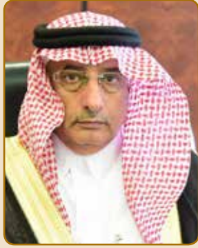
مدير الجامعة أ.د. فلاح بن فرج السبيعي